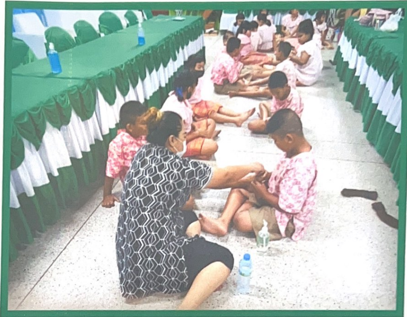
นักเรียนฝึกปฏิบัติตนวดฝ่าเท้าจากครูภูมิปัญญาท้องถิ่นในช่วงกิจกรรมพัฒนาผู้เรียน(ชุมนุมนวดฝ่าเท้า)