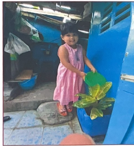
นักเรียนรักษาสิ่งแวดล้อมโดยการใช้ถุงผ้าแทนการใช้ถุงพลาสติก ปิดน้ำ ปิดไฟทุกครั้งหลังการใช้งานและปลูกต้นไม้ภายในบ้าน